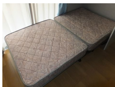
ベッドマット 開いた状態