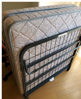
ベッドマット 閉じた状態